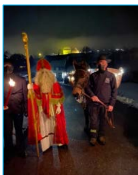
Saint Nicolas à Vuadens