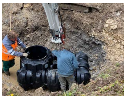
travail de sourcier au Chrine BE