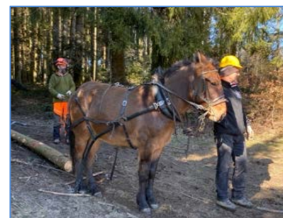
débardage à Saint Martin