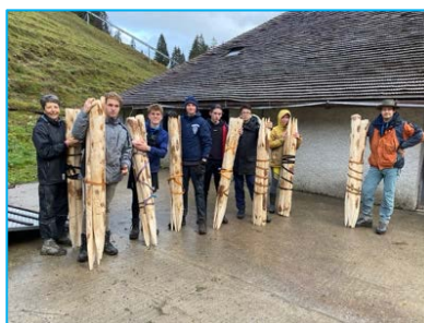
esprit d'équipe au Commun