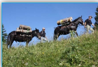
bois de feu pour Lauenen BE