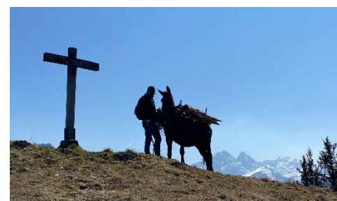
transport de piquets à l'Arsajoux